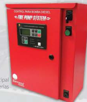
Tablero principal 1 o 2 baterías