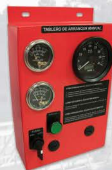
Tablero de arranque manual